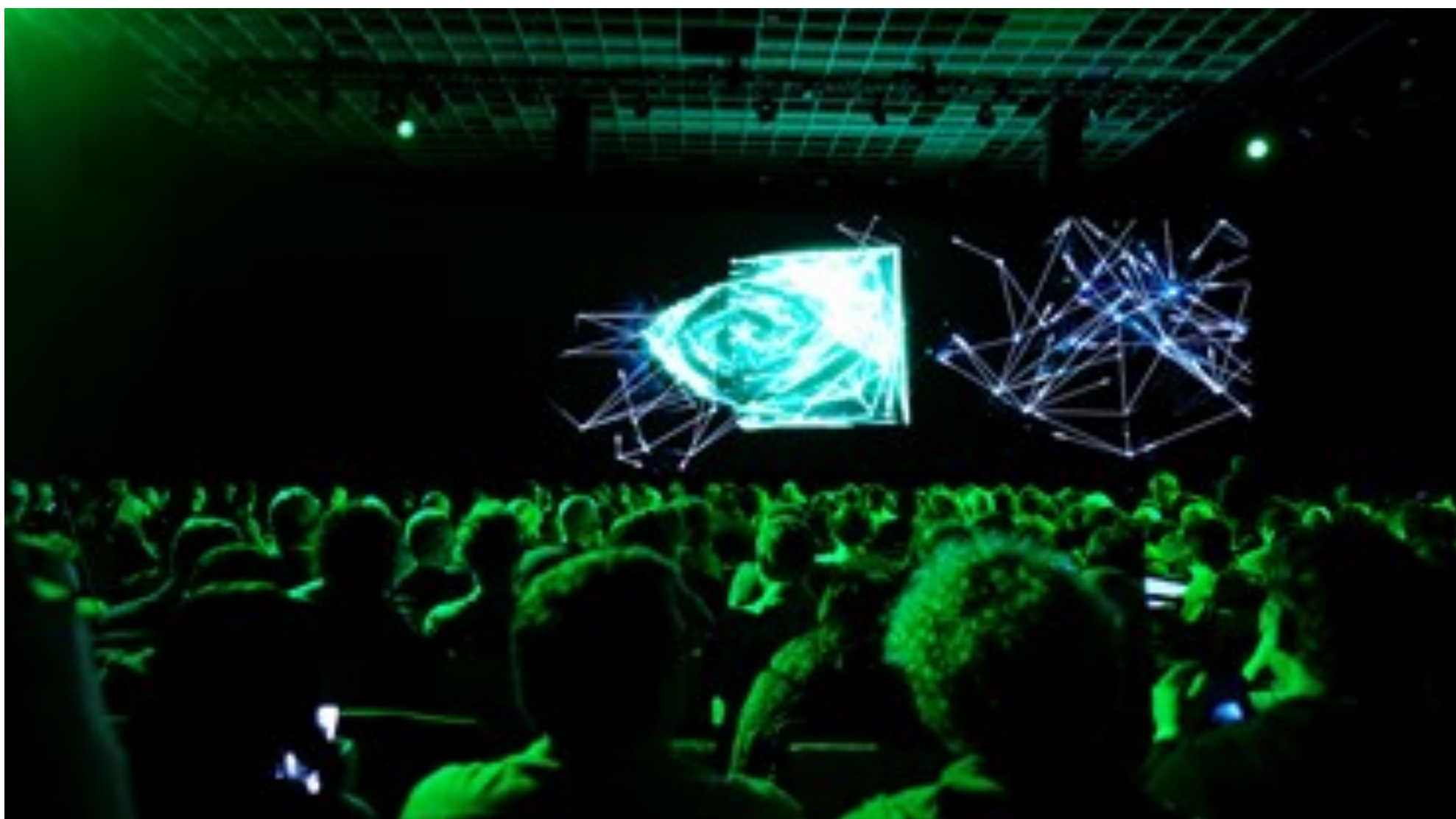
Una presentazione di Nvidia

E' possibile prendere posizione sul titolo del momento, Nvidia , attraverso strumenti del risparmio gestito?