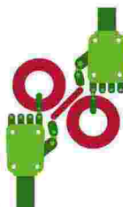
I migliori Etf sull'intelligenza artificiale